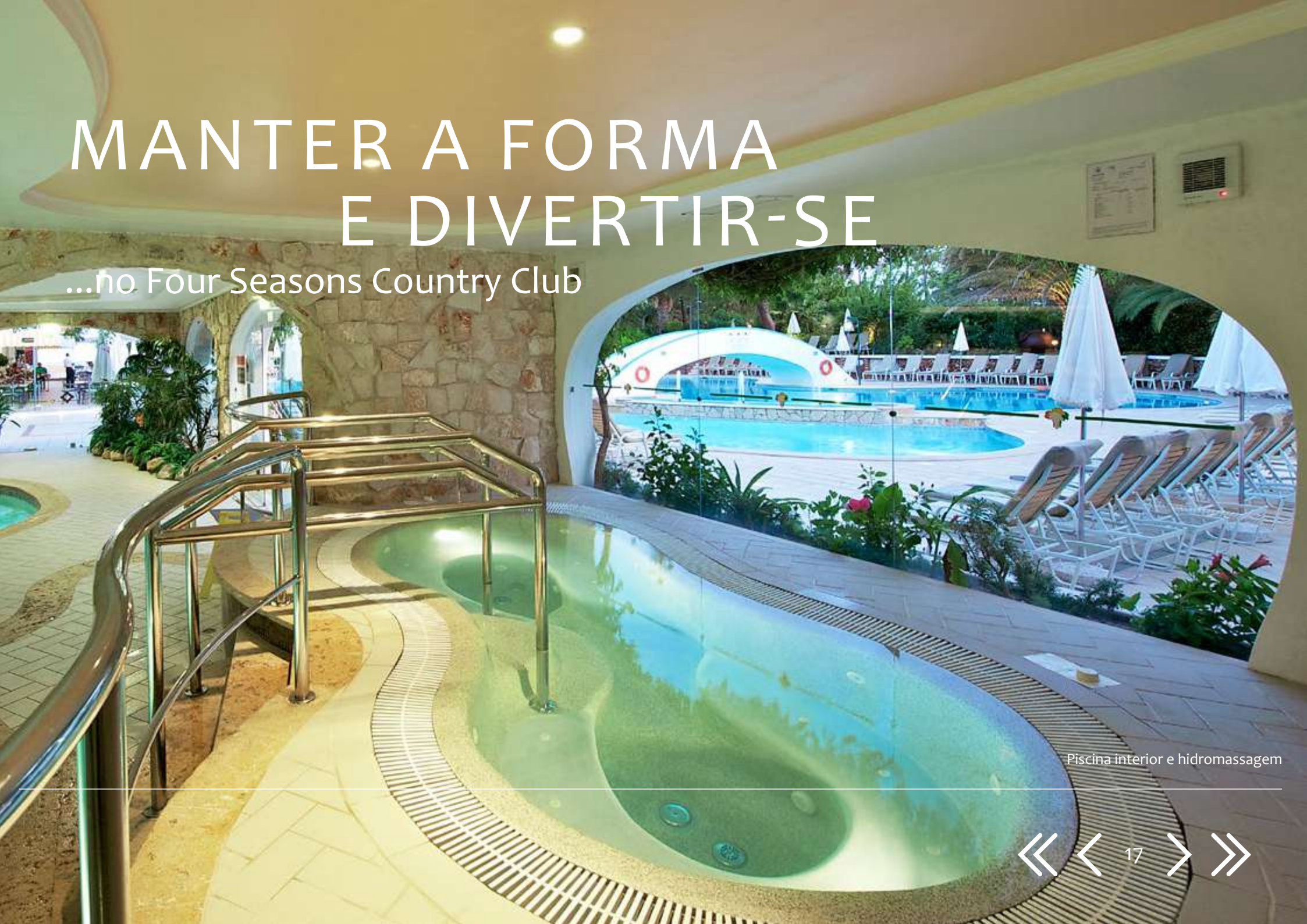
Piscina interior e hidromassagem