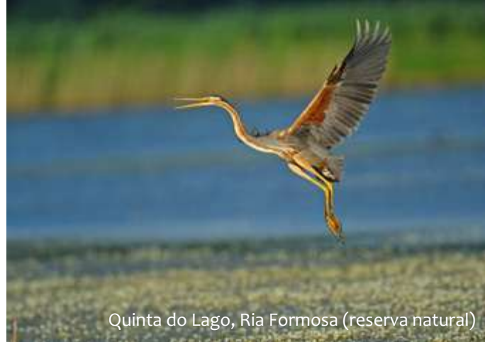
Quinta do Lago, Ria Formosa (reserva natural)