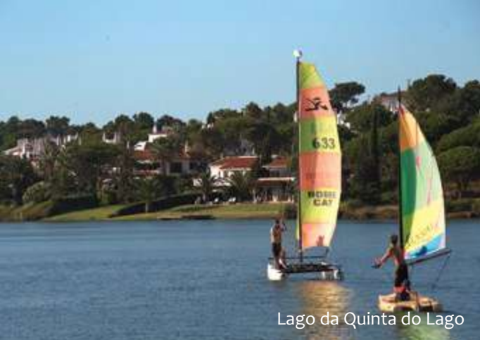
Lago da Quinta do Lago