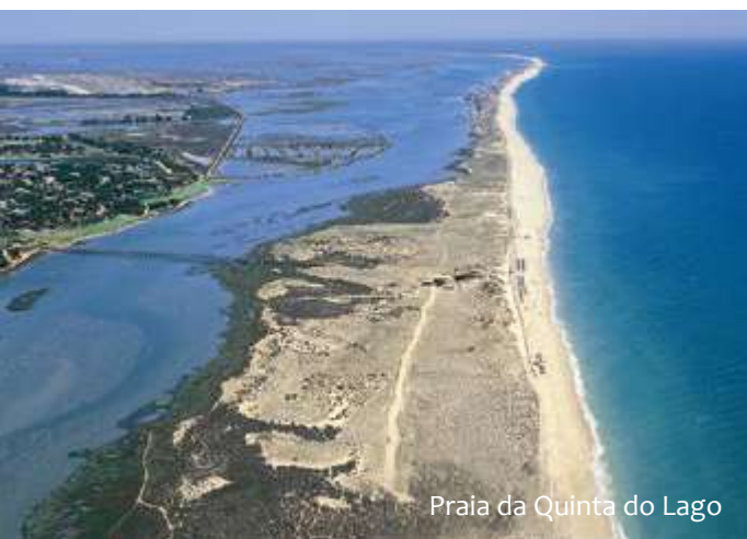
Praia da Quinta do Lago