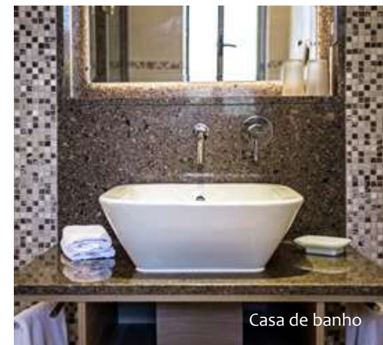
Casa de banho

As villas e apartamentos do Four Seasons Country Club caracterizam-se por linhas limpas e frescas, assim como, por um design moderno e suave. As casas de banho têm vidro e granito, o que aumenta a sensação de espaço e luxo.