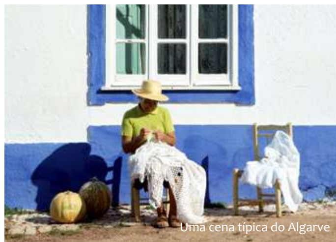
Uma cena típica do Algarve