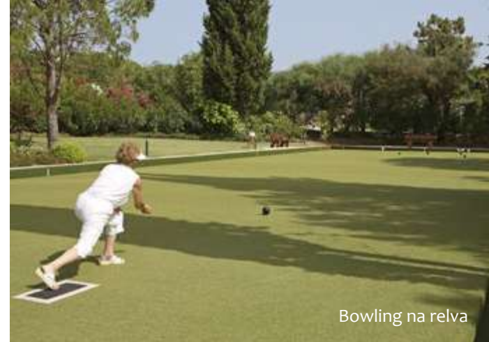
Bowling na relva