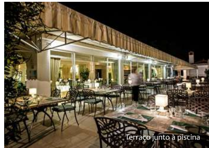
Terraço junto à piscina

No Four Seasons Country Club, confeccionamos especialidades portuguesas e os melhores pratos internacionais, todos eles acompanhados por uma excelente seleção de vinhos.