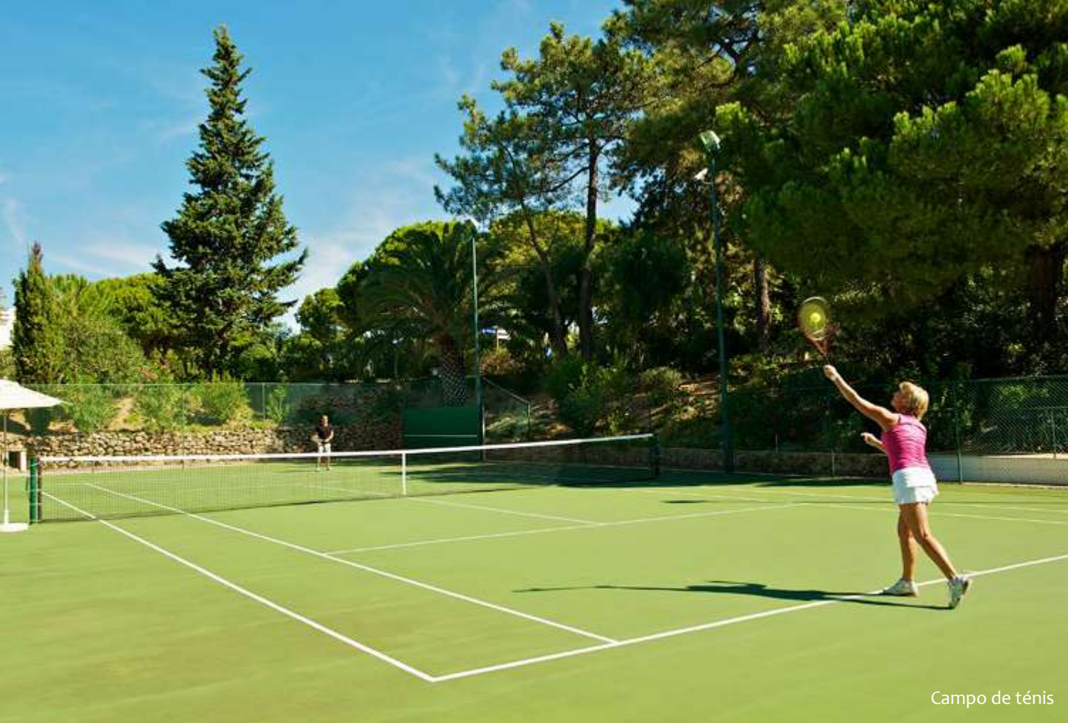
Campo de ténis