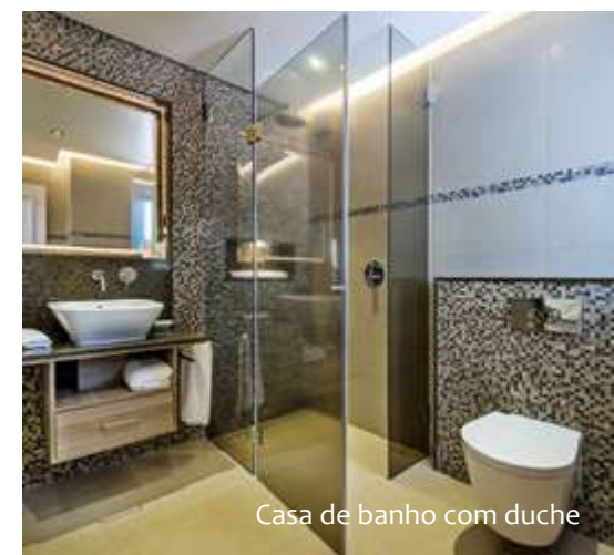
Casa de banho com duche

Toda a mobília tem tons calmos e neutros que dão uma sensação de relaxamento e bem-estar.