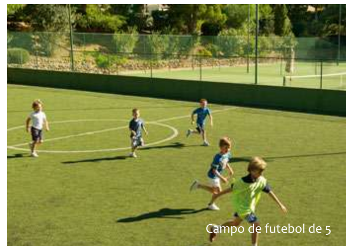
Campo de futebol de 5