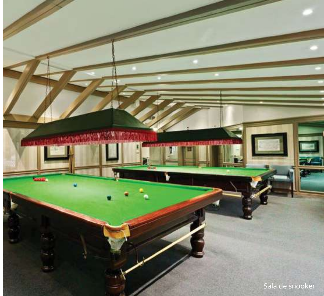
Sala de snooker

"Nós ainda gostamos de cá vir passados 20 anos, é sempre muito bem gerido, o restaurante é excelente e vocês conseguem manter a equipa mais charmosa e acolhedora, o que realmente faz valer as nossas visitas. Parabéns a todos."